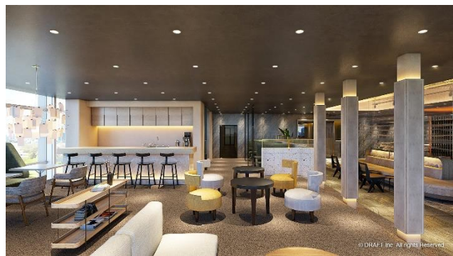
ouno 御堂筋カフェスペース