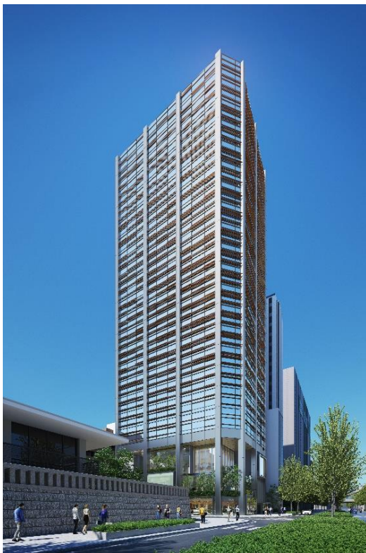
御堂筋ダイビル外観