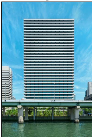
旧ビルのイメージを継承する横基調のデザイン