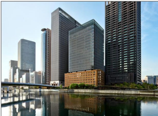
堂島川からダイビル本館を望む