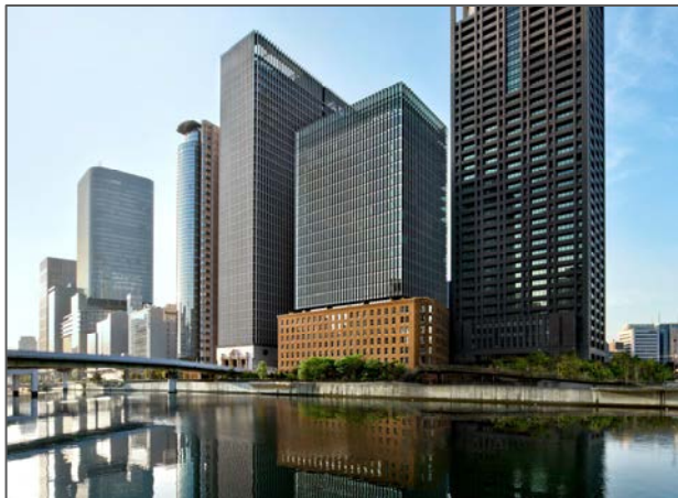
堂島川からダイビル本館を望む