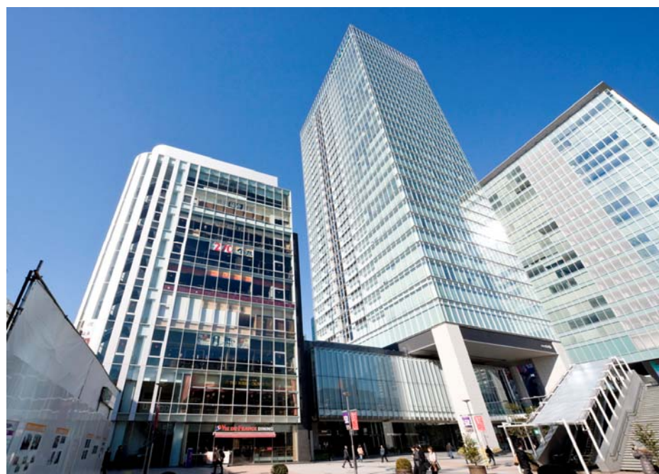
秋葉原ダイビル・駅前プラザ（左）と秋葉原ダイビル（中央）